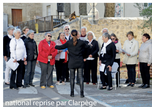
national reprise par Clarpège