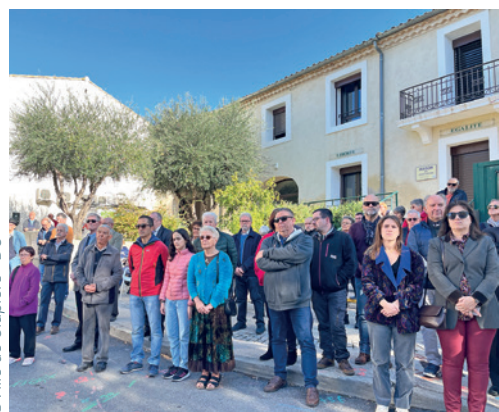
© Ville de Clapiers - DC