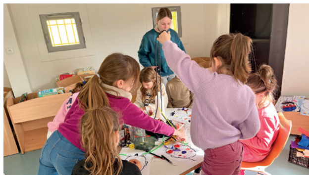
👉 On dessine, on coud, on peint... et nos masques prennent vie !