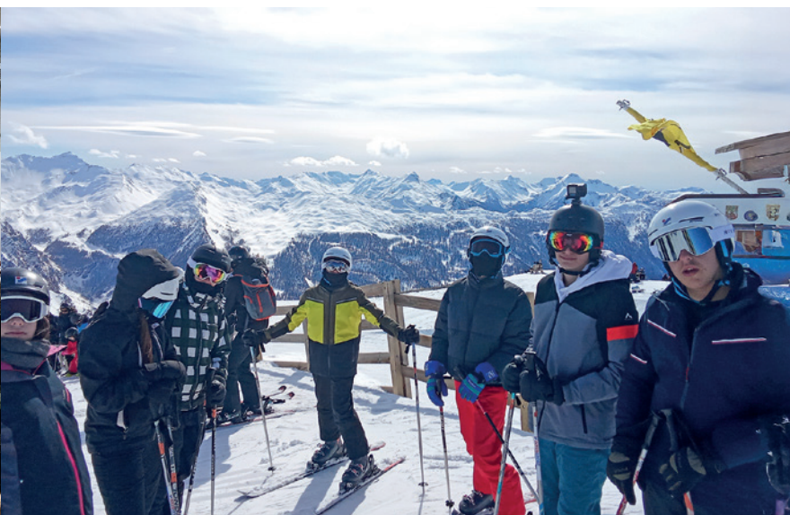
👉 Un instant hors du temps entre amis face à la beauté des sommets

les défis musicaux. Ils ont apprécié la haute montagne, savouré les animations proposées et fait le plein de bons moments vécus ensemble.