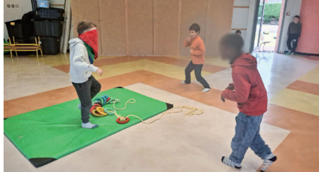
👉 Médusa agite ses tentacules

L'Imagination a régné sur ces vacances d'hiver. Chaque jour, en moyenne, 24 enfants pour Mélodie et 22 pour Harmonie ont pu s'immerger dans l'univers légendaire des "animaux fantastiques". Magiques et toujours fascinants, ceux-ci ont inspiré les enfants pour notre Bonhomme Carnaval, créé avec l'équipe d'animation. Une équipe qui les a emmenés s'amuser au parc, découvrir l'univers marin à Planet Ocean, jouer ensemble au gymnase. Ateliers masques et cuisine, repas raclette... ces journées ont passé comme l'éclair pour nos petits.