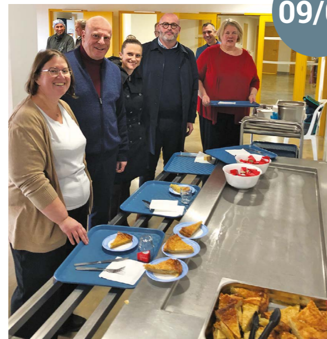
Galette des rois pour la rentrée au restaurant scolaire, avec le maire, les élus et le prestataire. Une nouvelle collaboration qui s'ouvre avec une boussole : le bien-manger des enfants clapiérois.