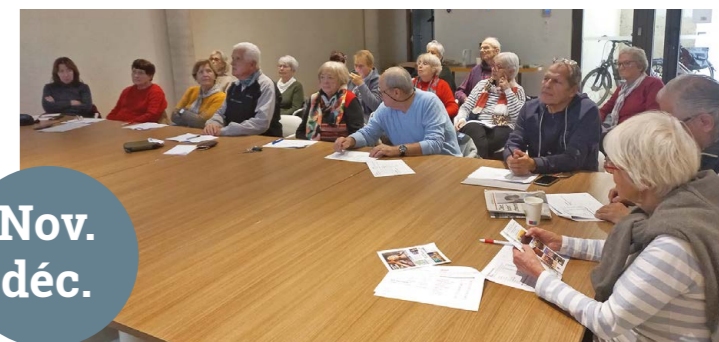
Cet atelier mémoire de "Brain up" s'est étalé sur deux mois. Spécialement conçu pour les seniors afin de stimuler la mémoire et encourager les échanges. Animée par un professionnel, cette activité interactive a accueilli au total 18 participants et a offert un espace convivial permettant de renforcer les liens sociaux.